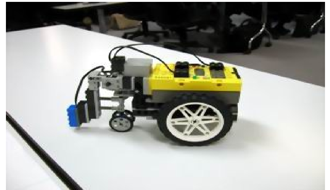
パスファインダー (車体)

イメージとしては模様入りの厚手の布のようなもので、大きさは12畳分。イン、アウト2本引いてあり、競技では両方とも走行します。分岐点には「難所」として、「点線ショートカット」、「Zクランク」、「坂道」があります。